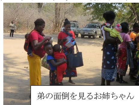
弟の面倒を見るお姉ちゃん