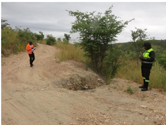
↑水の通り道があり、削られてしまう箇所。 崩れ落ちるのでは？という心配もあります。

どんな作業が適するのかわ、何ができるのかわ。これから相談し、できる範囲の中で対処していく予定です。