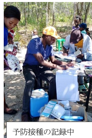
予防接種の記録中