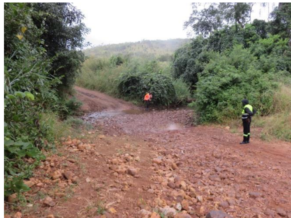
↑激しい雨の後、増水する小川。 水位が下がるまで渡れなくなります。