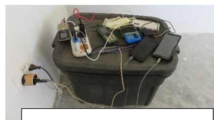
ソーラーシステムを利用して携帯電話を充電する人続出