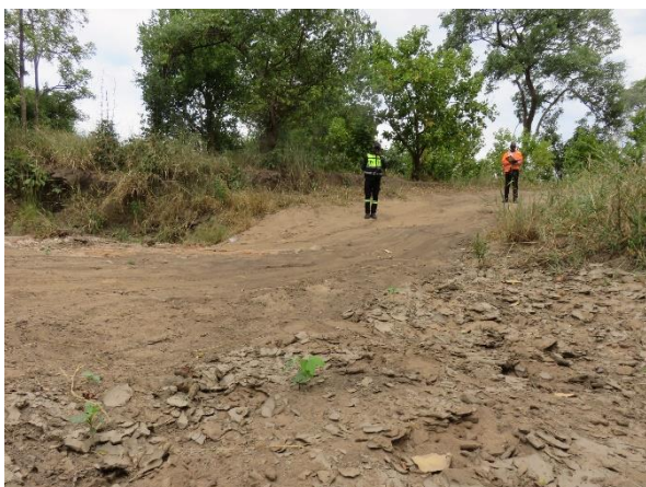
←雨が降ると、ぬるぬるドロドロになるところ。