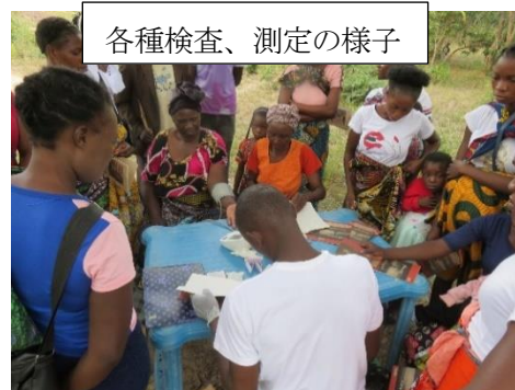
各種検査、測定の様子