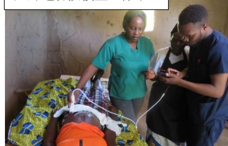
妊婦超音波検査の様子