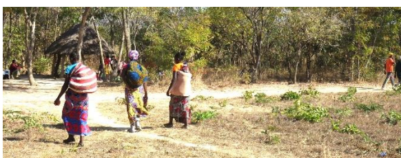
*診療を終え帰る女性たち (背中に赤ちゃんを背負っている)