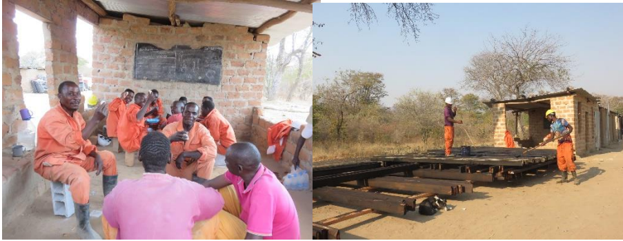
左：現場スタッフのランチの様子