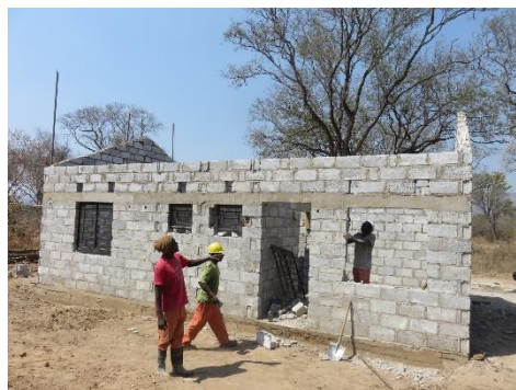
左：スタッフハウス、輪郭が出来てきました

建設は順調に進んでいます。この一ヶ月で、スタッフハウスにおいては建物の外壁ができ、窓枠も取り付けられてきました。ヘルスポスト本体も床のコンクリートが張られ、外壁のブロックが積み重ねられています。写真をご覧ください。今後も具体的な建設の様子等、進捗状況をお知らせします。