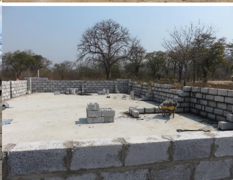
右：ヘルスポストの外壁が積み上げられています