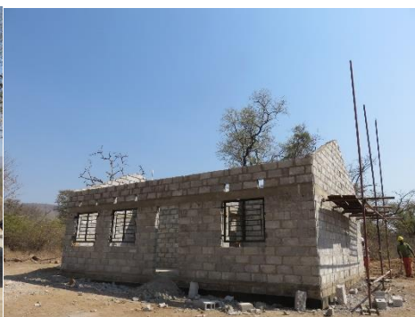
右：スタッフハウス窓枠が付けられています