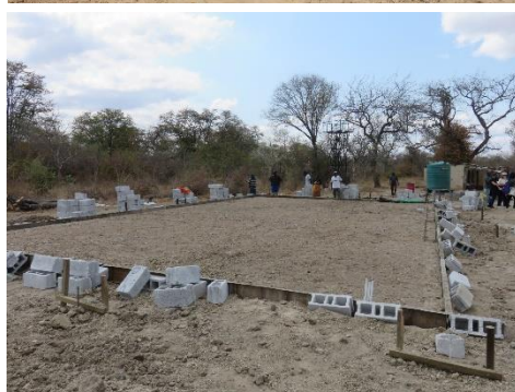
左：ヘルスポスト基礎が整地されました