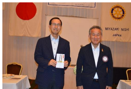
*会長と記念撮影（寄附をいただきました）

・8月18日、宮崎西ロータリークラブの例会の場で、約100名の会員の皆様に ORMZ の活動について紹介を行いました。プログラム委員の方がホームページをご覧になり、私達の活動に興味を持っていただきお招きいただきました。30分間、会の成り立ちから現在の活動、ヘルスポスト建設などについてお話しをさせていただきました。