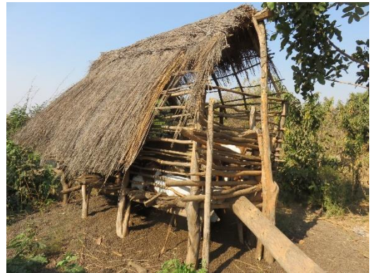
*ヤギさんの家がありました