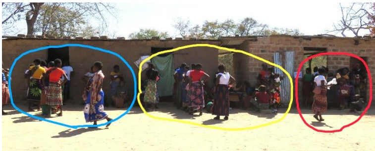
*診療を待つ人々の列、右から 受付 妊産婦検診 ファミリープランニング