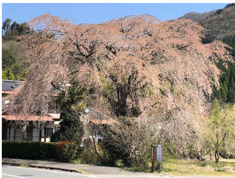
宮崎県五ヶ瀬町三ヶ所のしだれ桜です