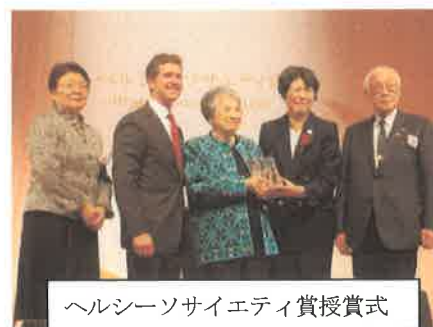
ヘルシーソサイエティ賞授賞式

・11 月 20 日、午後 8 時、「道なき道の彼方へーへき地を診る医師ー」が宮崎県内で再放送。