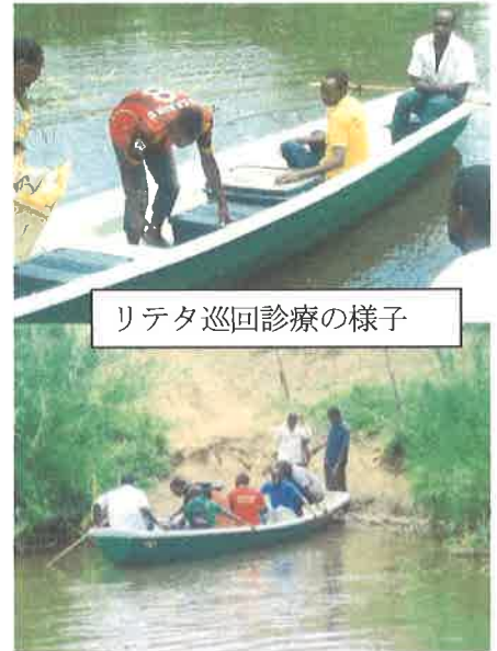
リテタ巡回診療の様子

私は私用のため12/12にはルサカを発ち帰国しました。この日は巡回診療の日で事務所には誰もいなかったのですが、私が事務所を出て1時間半後（午後3時頃）に裏口のドアをこじ開けられて、泥棒に入られました。私の寝室のクローゼットに入れていた金庫が盗まれました。その日の午前中に大きなお金は日本人に預けていたので、金庫の中は私個人のお金約3万円と運転免許証、様々な書類の原本でした。事務所内にたまたま置いてあった運転手の新品の自転車はそのままだったこと、薬剤は盗まれていなかったことなどから、運転手の関係者の犯行ではないかと疑われていますが、確証はありません。犯人が捕まる可能性はほとんどありません。留守をお願いしている日本人の方が警察の調査などに立ち会って下さり、とても助かりました。また鍵を全て取り換えていただきました。ほんとうにお世話になりました。ありがとうございました。今後も同じ体制で活動を継続するのは難しく、誰かが常駐しないとイケないのではと考えています。乗り越えないといけない問題はいろいろあります。雨季の間、診療は中止になることもあるかもしれませんが、活動は続いています。これからもみなさまからのご支援をよろしく願い申し上げます。ありがとうございました。