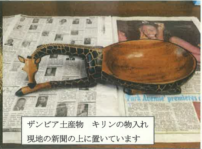
ザンビア土産物 キリンの物入れ 現地の新聞の上に置いています