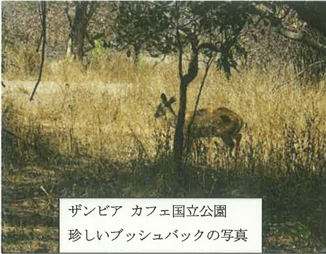
ザンビア カフェ国立公園 珍しいブッシュバックの写真