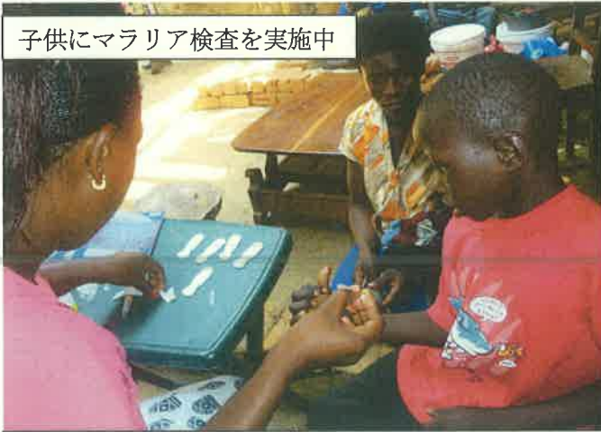
子供にマラリア検査を実施中