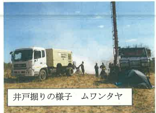
井戸掘りの様子 ムワンタヤ

21日にはムワンタヤにトラックが入り、22日から掘削が始まり、その日のうちに水が出たとの連絡を受け、23日に見に行きました。水が出た時には大勢の人々が集まり、ダンスをしたりとたいへんな盛り上がりだったそうです。2か所目の掘削も始まっていました。