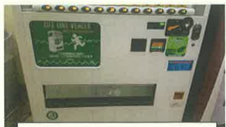
災害時に自動で利用できます