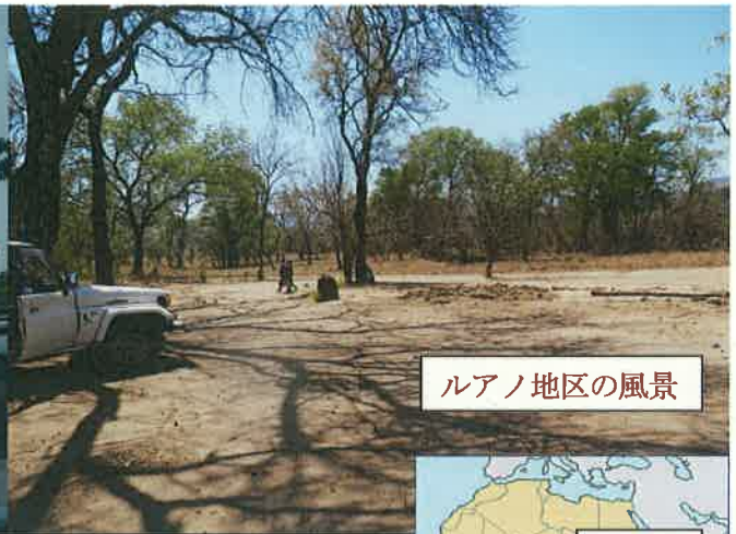
ルアノ地区の風景