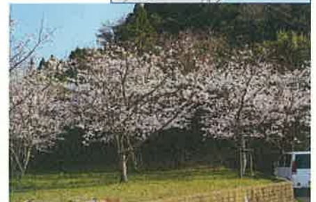
(近所の桜が八部咲き)

いろいろと手続きが必要で、また認定を受けるための基準がいくつもあるのですが、その一つを現状では満たしていないことが判明しました。「寄付金収入の70%以上が事業費に使われていないといけない」という基準なのですが、本来事業費にすべき事項を管理費にしていたことや、購入した車の費用をそのまま事業費に当てられないことなどがわかり、3月16日に理事会、22日に臨時総会を開催し、